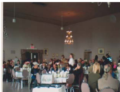
Plus de 135 personnes étaient présentes à la Matinée conférence