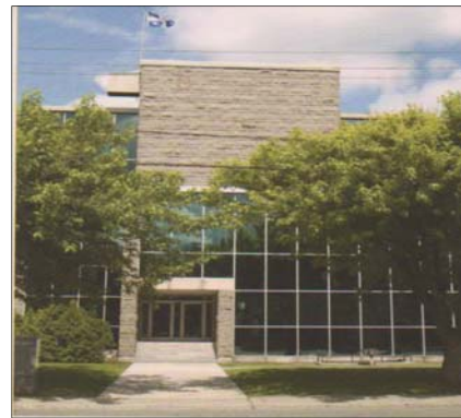
Palais de justice de Drummondville où s'en tenue l'assemblée générale annuelle

Vous y trouverez également une foule d'informations notamment la procédure ainsi que le formulaire à compléter dans le but de devenir membre du CAVAC Centre-du-Québec.