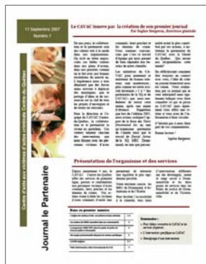
Le premier numéro du journal le Partenaire publié en septembre 2007

Le Journal Le Partenaire, fait peau neuve ! Par contre sa mission reste la même !